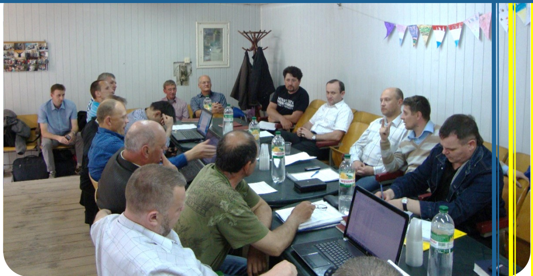
Vertegenwoordigers van de UERC kerken in vergadering bijeen op de Synode te Kiev, mei 2014

Het strategisch beleidsplan 2015-2019 is tot stand gekomen met inbreng van de volgende medewerkers in Oekraïnezending: